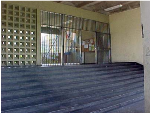
Fig 1 - Faculdade de Educação Física – unidade do Campus da Ilha do Fundão com muitas barreiras de acessibilidade