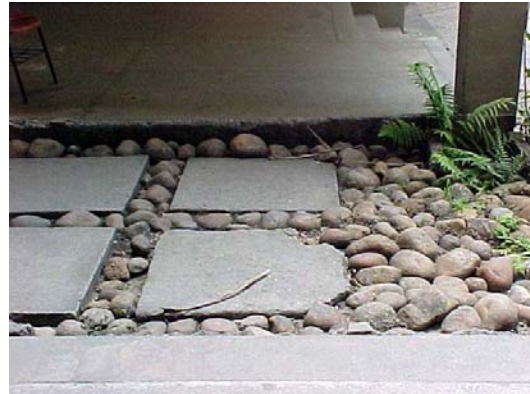
Fig.2 - Faculdade de Letras – pavimentação ruim