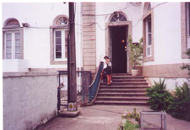
Fig.4 - Faculdade de Educação no Campus da Praia Vermelha